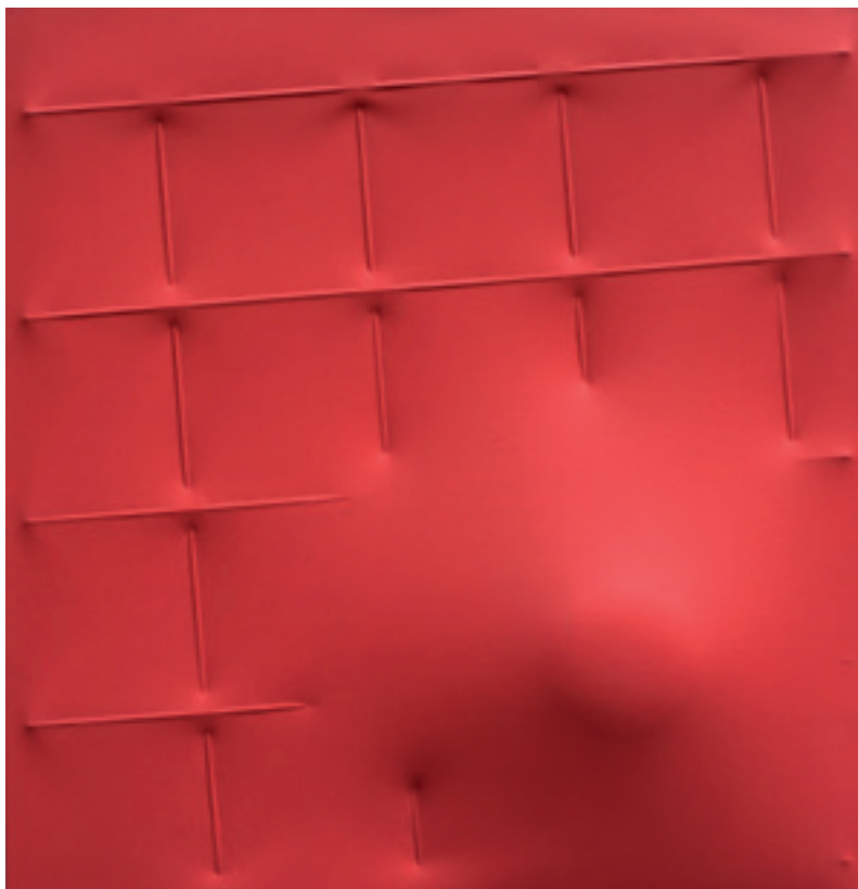
Agostino Bonalumi, Rosso (2008) Tela estroflessa e acrilico

appartenendo a una generazione cresciuta con la globalizzazione, e per necessità, date le opportunità di formazione e di affermazione che offrono altre nazioni. Al tempo stesso, non dimenticano le proprie origini, sia in termini di storia dell'arte sia del paesaggio (fisico e antropologico) del Belpaese; e non temono di farne l'oggetto della propria opera, o almeno il punto di partenza. Dopo Cattelan, i giovani artisti italiani non hanno, insomma, più imbarazzi a mostrarsi italiani».