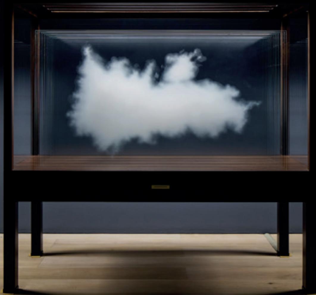
Leandro Erlich, Cloud (UK 2016) Vetro ultra chiaro, inchiostro di ceramica, legno, luce Mori Art Museum, Tokyo (Japan 2017)

LA FIERA D'ARTE DI BOLOGNA, GUIDATA DA SIMONE MENEGOI, PUNTA SULL'ITALIANITÀ APERTA SEMPRE DI PIÙ AL CONTESTO INTERNAZIONALE, PROMUOVENDO LE NUOVE GENERAZIONI ACCANTO AGLI ARTISTI STORICIZZATI