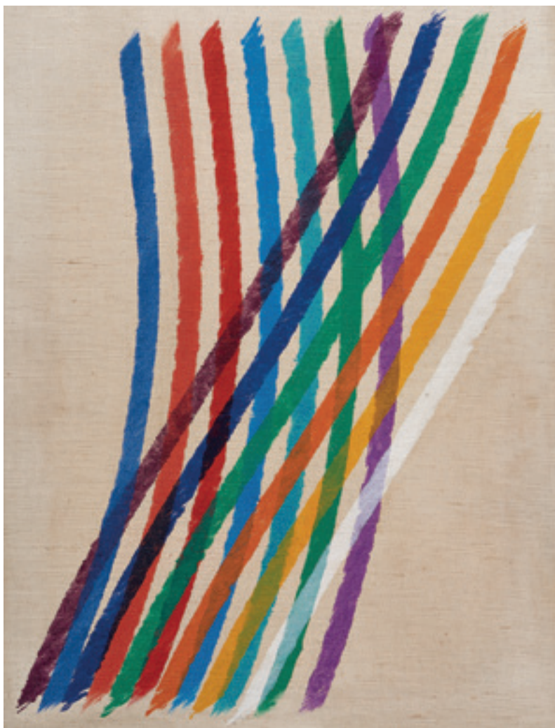
Piero Dorazio, Gagliarda (1965) Olio su tela

I talo Calvino? Le Lezioni americane ? La leggerezza è la prima associazione di idee che viene spontanea, pensando a questo suo libro postumo. Prendere la vita con leggerezza. «Che leggerezza non è superficialità, ma planare sulle cose dall'alto», per dirla con le sue parole. Tutto ciò, lo sappiamo, ha avuto successo, tanto da diventare persino un modo di dire. Ma rappresenta soprattutto, a mio avviso, un invito – sempre attualissimo – a esercitare diversamente il nostro sguardo e i nostri sensi per superare le apparenze intorno a noi e le loro leggi fisiche. Facile a dirsi, difficile però a realizzarsi. In questo, tuttavia, ci può venire in soccorso l'arte contemporanea che applica questo stesso modello di pensiero "divergente". E, per farne una vera e propria full immersion, l'appuntamento è a Bologna. Ad Arte Fiera. Prima fiera d'arte ad aver aperto in Italia, è la prima anche nel calendario artistico 2019 (1-4 febbraio). Strategica nella sua collocazione geografica, si candida per tornare a essere un punto di riferimento del mercato nostrano dell'arte. Missione non facile per il suo nuovo capitano