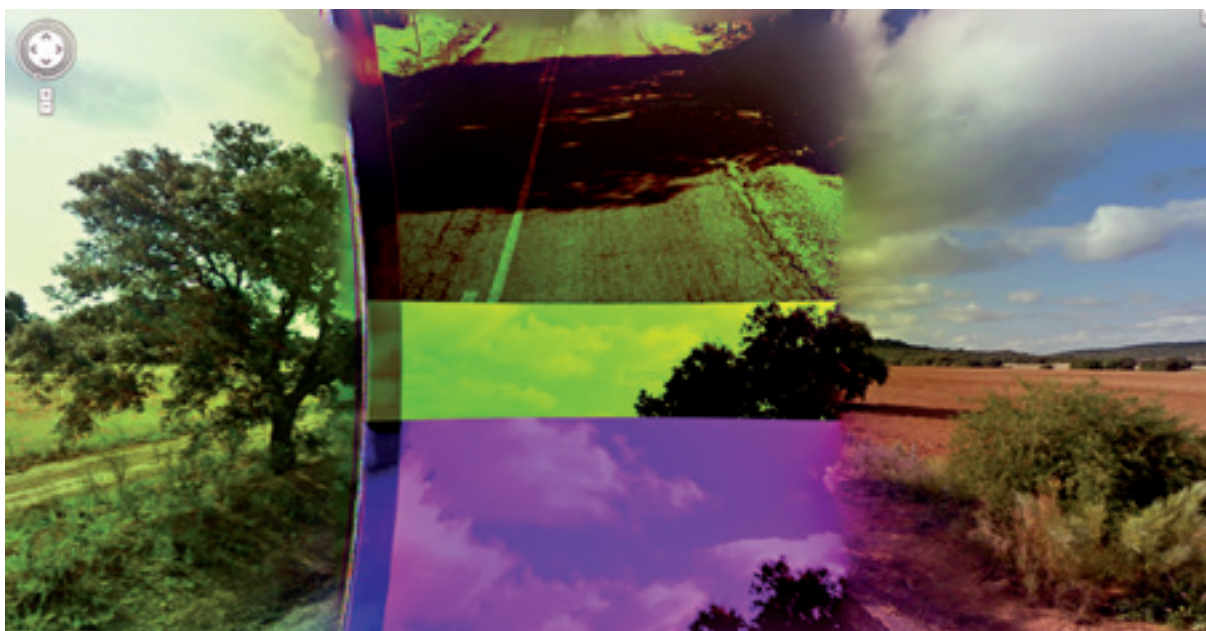
Emilio Vavarella, The Google Trilogy "Report a Problem" Serie di 100 immagini