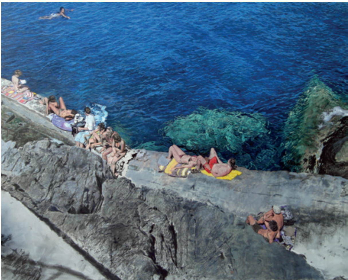
Giovanni Iudice, Sea inside 1 (2018) Olio su tela