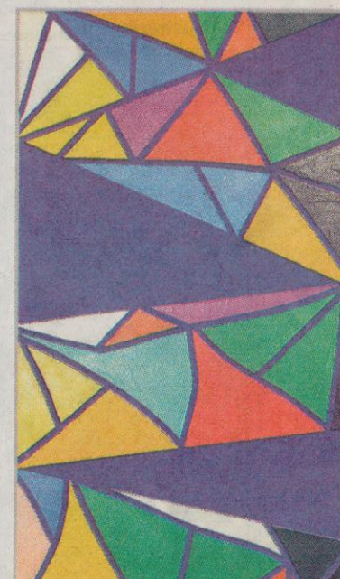
Piero Dorazio, A meno II (1973), olio su tela, portato a Arte Fiera dalla galleria Il Mappamondo