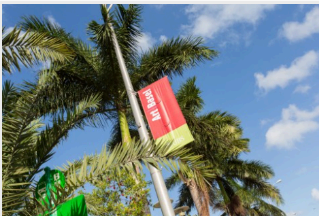
Art Basel Miami Beach 2014