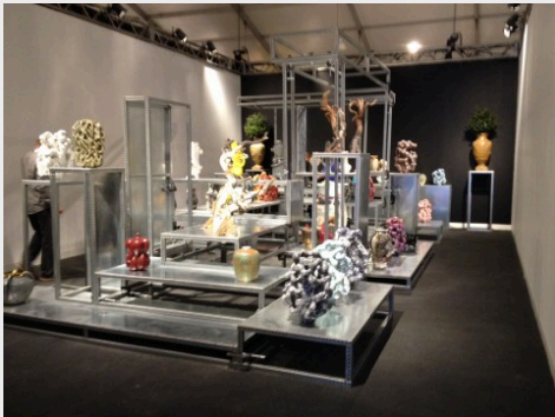
Design Miami 2014