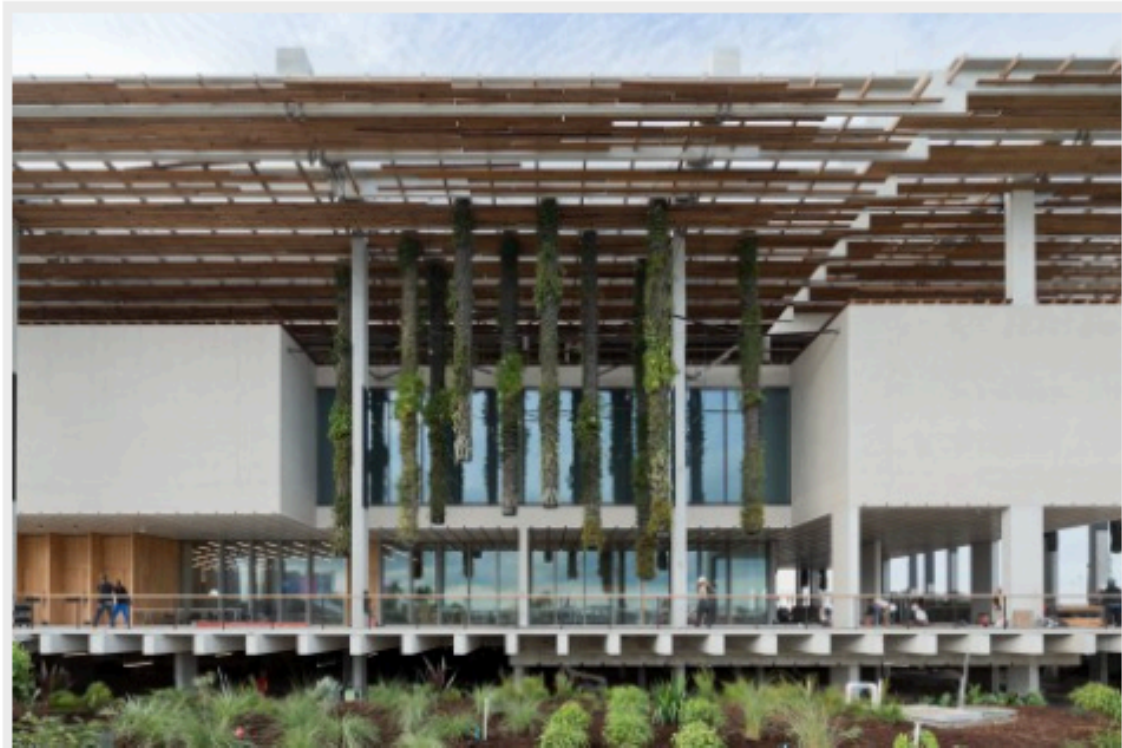
Pérez Art Museum Miami